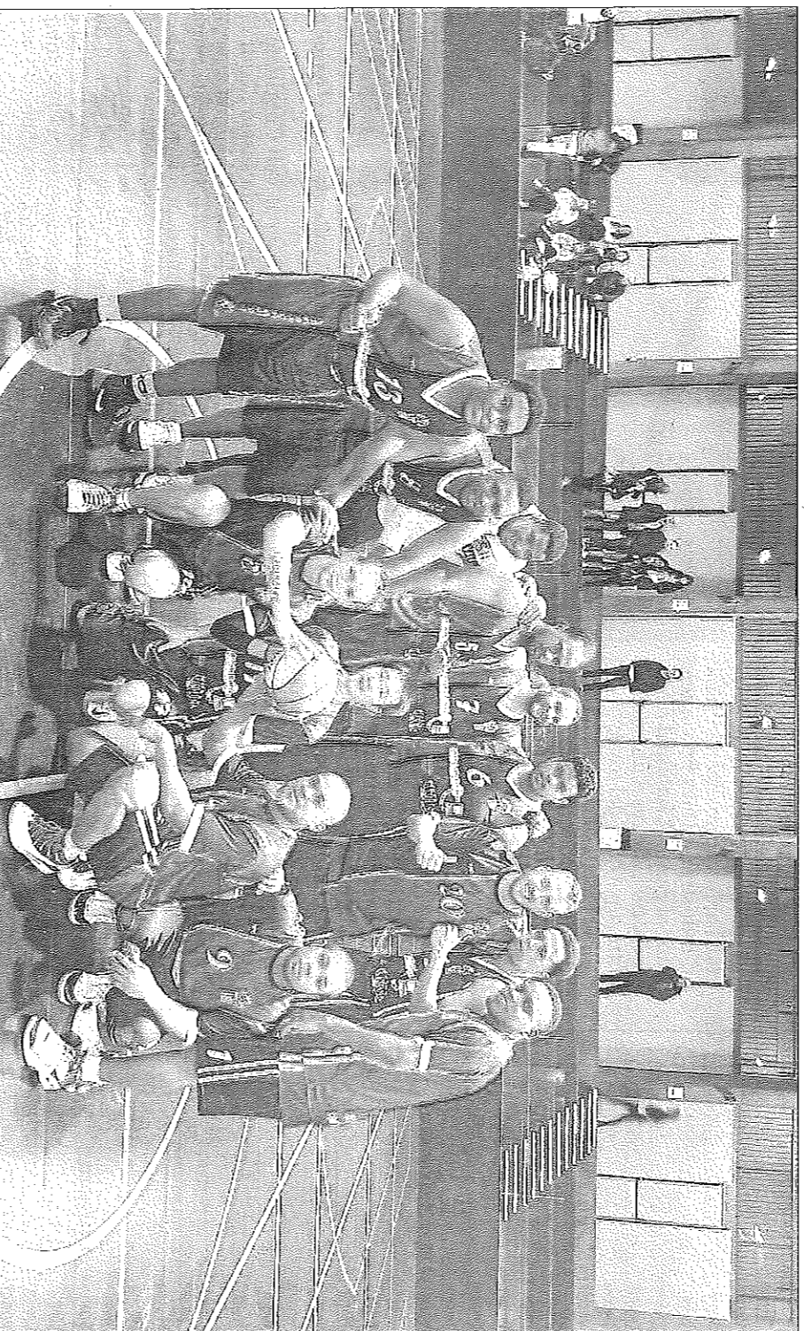
L'equip del Dominicans-Secà Sant Pere, que juga a la Territorial sènior, abans d'un partit.

"Amb el temps se'ns va proporcionar un pavelló, un entrenador i vam organitzar tornejos i partits amistosos. Això defini-